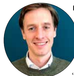
Laurens Dassen namens Volt:

kinderen. Hiervoor is wel budgettaire dekking nodig en die is vermoedelijk lastig te vinden. Mogelijk dat hier tijdens de behandeling van het volgende Belastingplan voorstellen voor gedaan kunnen worden.”